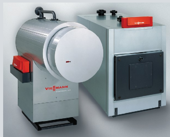
Vitocrossal 300 – газовый конденсационный котел мощностью от 187 до 978 кВт