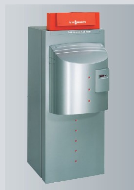
Vitocrossal 300 мощностью от 27 до 142 кВт